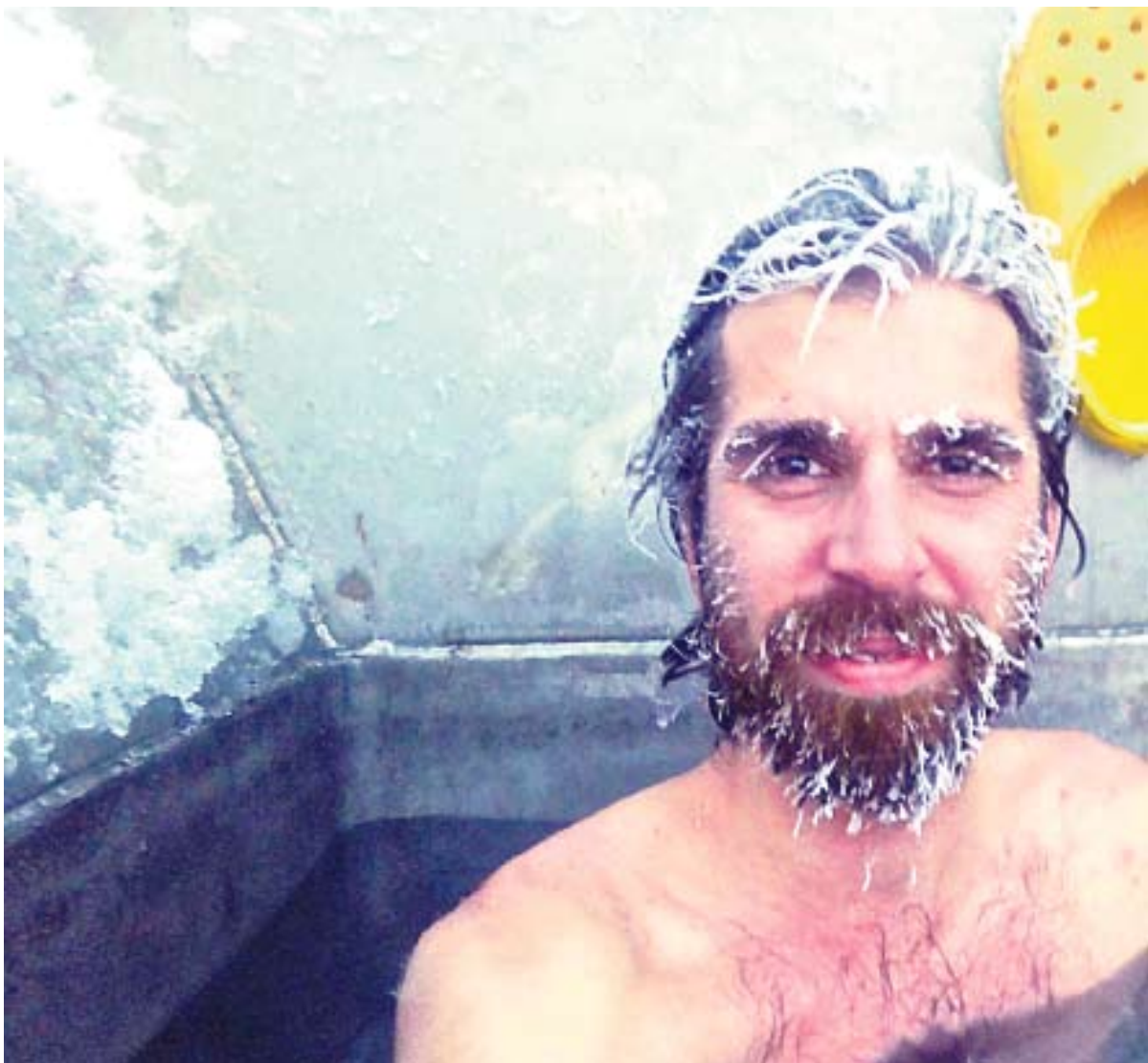
A.Kumarui darbas Antarktidoje, nepaisant ekstremalių fizinių ir psichologinių ištvėmės išbandymų, tapo gražiausiu ir neįtikimiausiu.

Be to, mes galime stebėti, kas vyksta pasaulyje: sekti pilietinius karus, gauti žinių iš savo